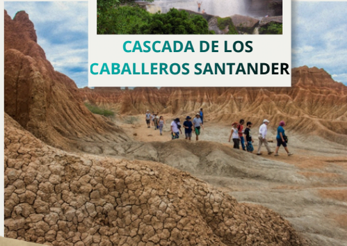
DESIERTO DE LA TATACOA