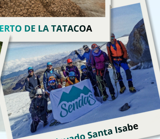
Cumbre Nevado Santa Isabe

Gracias a este convenio, ahora podrás disfrutar de: